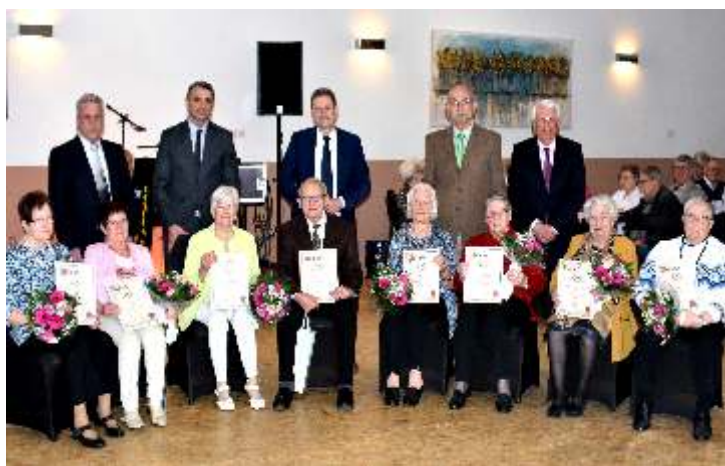
Invaliden- und Senioren- verein Setterich 1969