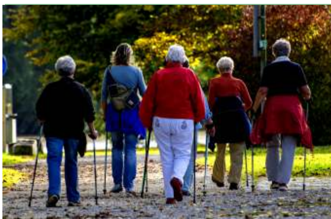
Fit und Mobil 55+