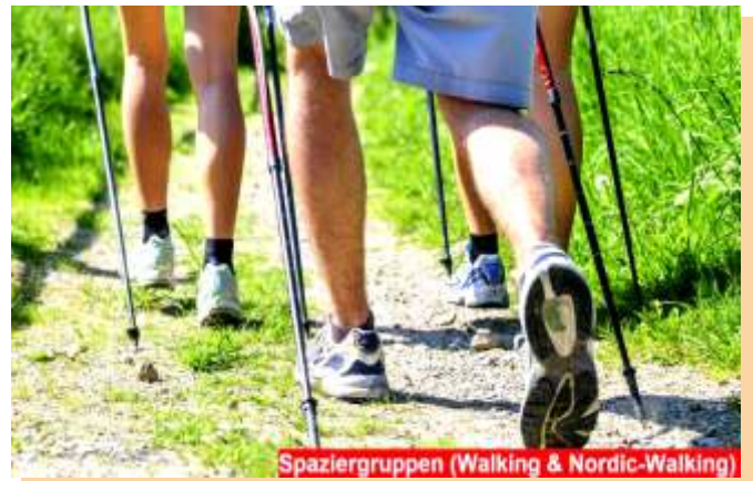
Spaziergruppen (Walking & Nordic-Walking)

Anmelden können Sie sich im Stadtteilbüro DRK, Tel.: 02401-6037238