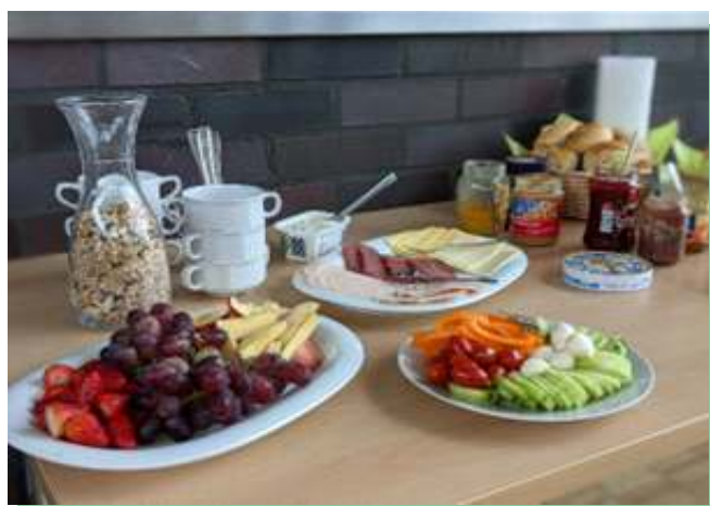
Angebote für Mütter