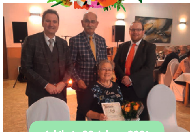
Jubilarein 20 Jahre - 2021