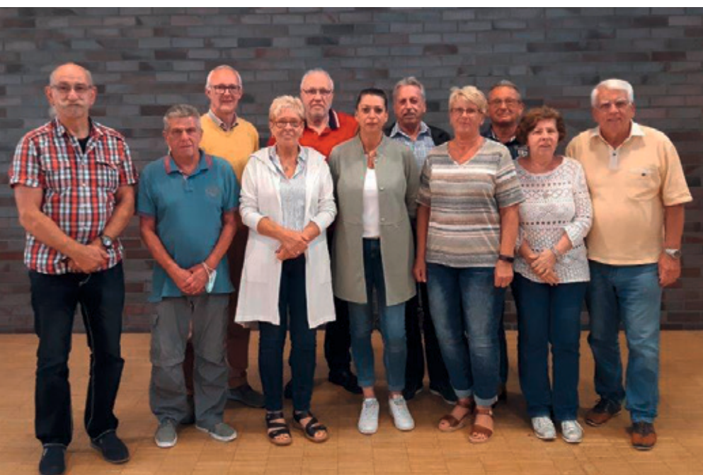
Der neue Vorstand

Liebe Settericher Mitbürgerinnen und Mitbürger,