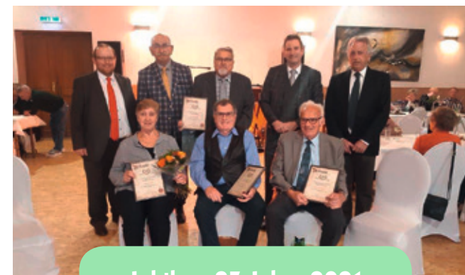
Jubilare 25 Jahre 2021

Gruppe werden in einer Runde mehrerer Mitglieder verschiedener Institutionen, die sich u.a. mit der Lebenssituation älterer Mitbürger in dieser Stadt und deren Freizeitangeboten befassen, unterschiedliche Strategien und Konzepte zur Verbesserung der Lebensqualität im Alter entwickelt. Hier ist bereits auf Vorschlag des 1. Vorsitzenden erreicht worden, dass in absehbarer Zeit im Außenbereich vom Haus Setterich eine öffentlich zugängliche Boule- bzw. Bocciabahn angeboten werden soll. Ein Angebot, welches hauptsächlich Senioren die Möglichkeit bieten soll, sich regelmäßig in angenehmer Runde zu treffen, um sich bei seniorenrecht sportlicher Betätigung niederzulassen und unterhalten zu können.