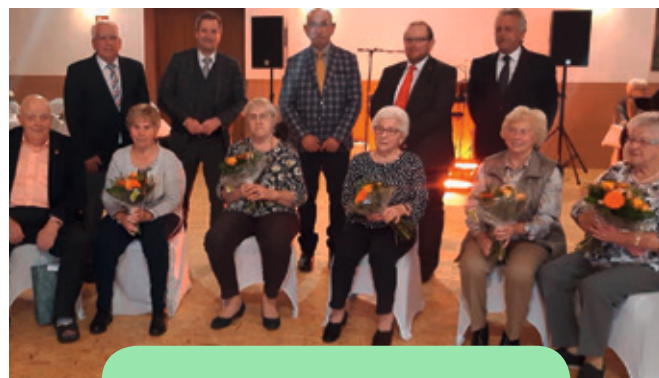
Jubilare 20 Jahre - 2020

nachträglich für ihre langzeitige Vereinsmitgliedschaft gebührend würdigen und auszeichnen konnten. Dieser gemütliche Abend mit Tanzmusik und der Einlage eines Dudelsackspielers fand im Oktober statt.